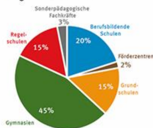
Diagramm 2: Bewerber